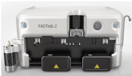
装置の外観 (FASTlab 2)